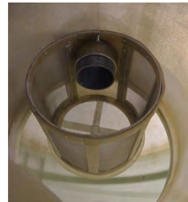
Cesta-filtro de sólidos